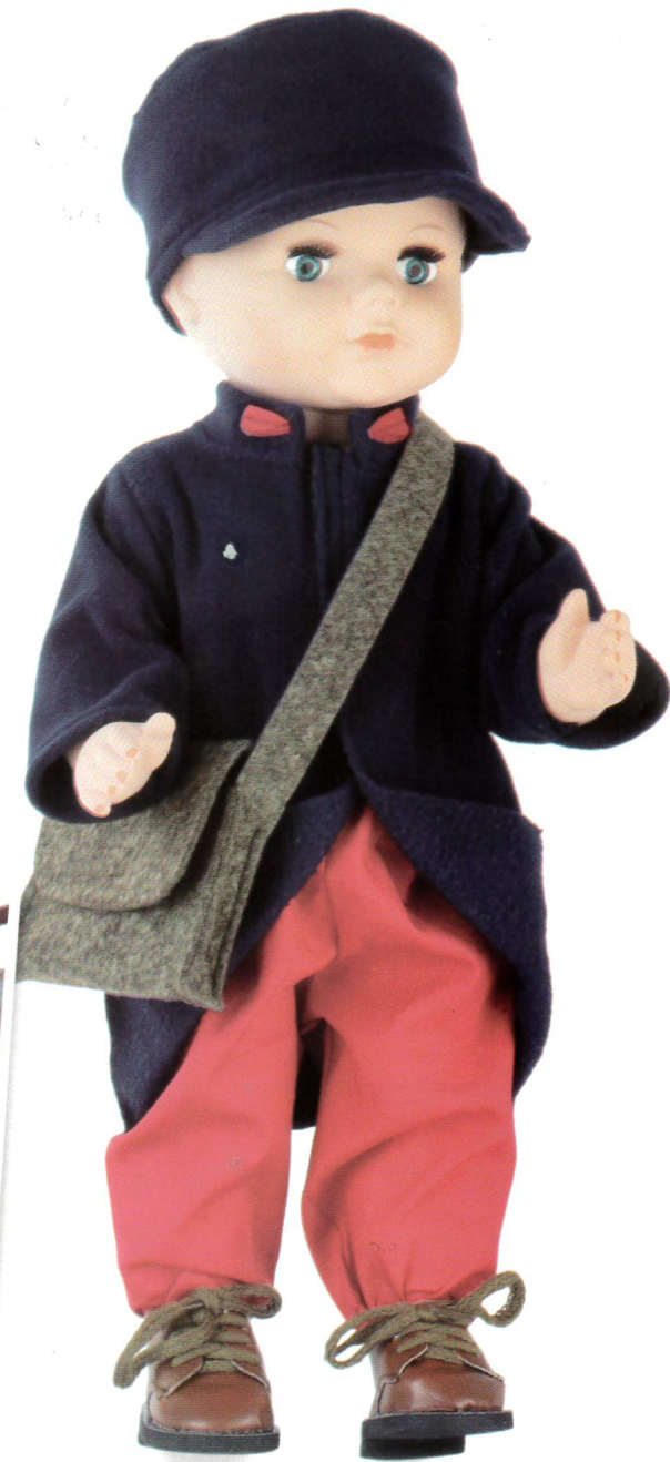
Nouveau Petit Colin «Poilu de 1914»