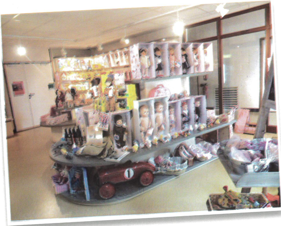
Boutique du musée de la poupée