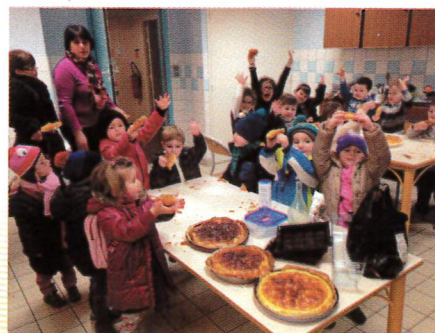
Atelier cuisine - Eix

Sur le site du Centre socioculturel, vous pouvez, d'ores et déjà, trouver les activités prévues pour la première période de l'année scolaire 2015/2016.